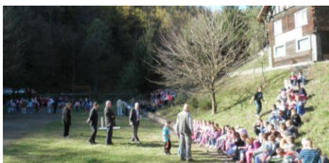
Crni Vrh – druženje