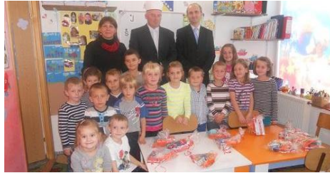
U Obdaništu Jelah