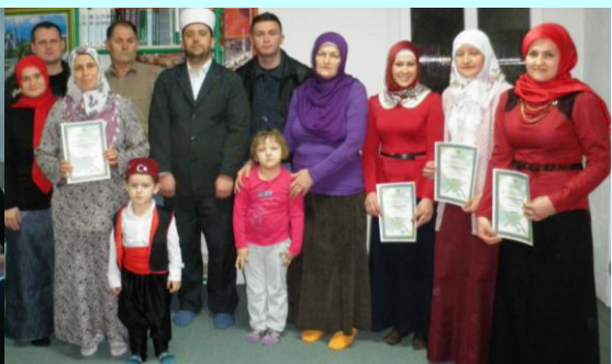
Miljanovci Novi – svršenicima kursa za učenje sufare