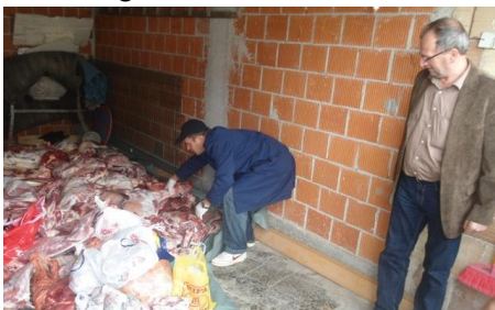
Predaja kurbanskog mesa