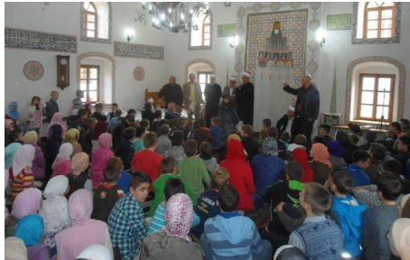
Podjela paketića: u Čarši džamiji

2. Čas historije i podjela prigodnih paketića polaznicima mektebske nastave –nedjelja 03.11.2013. god. upriličeni u većini džemata. Glavni imam prisustvovao podjeli paketića i održao čas na temu Hidžre u Čarši džamiji gdje su paketići uručeni za polaznike mektebske nastave iz Šarenog mekteba – džemati Čarši džamije, Dibekhane, Harman i Avdipašine džamije, te u Kutahya džamiji za polaznike mekteba iz džemata Bukva (punktovi Bukva, Čifluk, Logobare i Kutahya džamija).