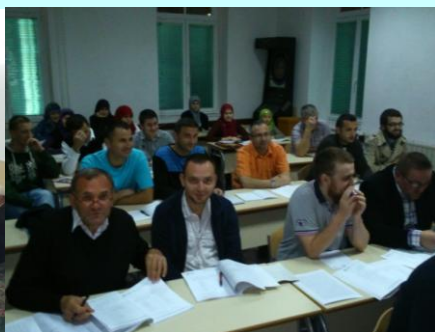
Šareni mekteb - Dio polaznika kursa