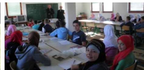
Piljužići - Posjeta glavnog imama