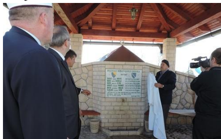
Bobare- Otkrivanje šeh. spomen obilježja