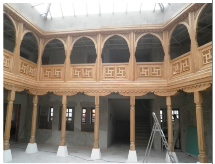
Završeni drveni radovi u atriju- 31.10.20132.g.