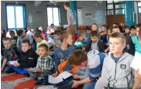
u Kutahya džamiji