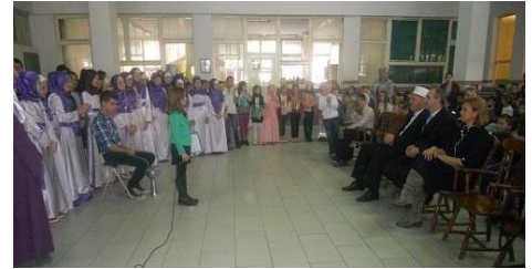
Priredba u OŠ „Huso Hodžić“

„Dan Arefata i Kurban - Bajram“ - 13.10.2013.g. - u džematima održan zajednički čas sa polaznicima mektebske nastave na navedenu temu, a u nekoliko džemata i podijeljeni bajramski paketići.