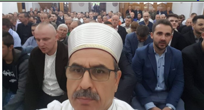
Bajram-namaz u Čarši džamiji - 15.06.2018.

Ramazanski bajram 2018. – 1439. (str. 5.)