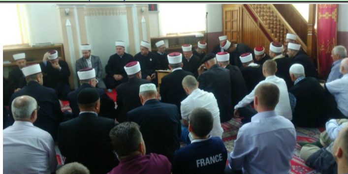
Raduša, Mevlud i dova za šehide – 16.06.2018.

Javni programi – Obilježen 3. maj „Dan šehida“ općine i 7. maj „Dan džamija“ 2018. (str. 6.)