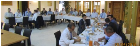
Iftar za profesore