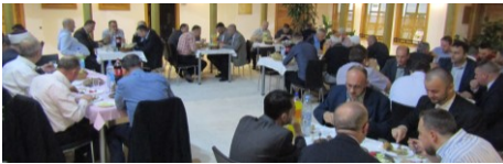
Iftar za zaposlenike i članove IO

Karakteristika ovogodišnjeg ramazana je povećanje svih mjerljivih pokazatelja (zekat, sadekatu-l-fitr, broj učača mukabela, broj teravih punktova, ...). Medžlis je samostalno ili u saradnji sa drugim subjektima organizirao iftare: -za imame i članove IO - 17. 05. 2018. -za profesore odgojno-obrazovnih ustanova IZ-e u BIH - 26. 05. 2017. Brojni iftari su organizirani u džematima (Šije, Piljužići, Novi Miljanovci, Jevadžije, O.Planje, Mrkotić-Putešić, Jelah, Dobropolje-Mekiš, Jevadžije...)