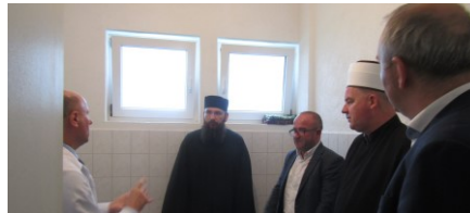
U sobi za molitvu