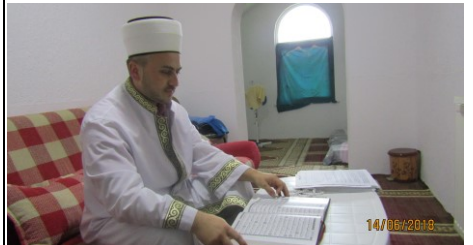
Muris ef. Bračkan – Mračaj-Potočani i