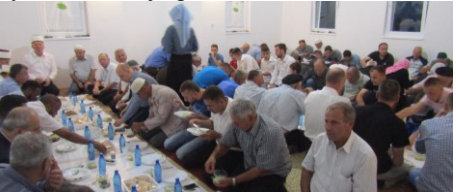
Iftar u novom mesdžidu Koprivci