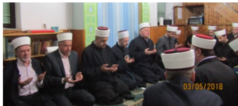
Medakovo – Mevlud i dova za šehide