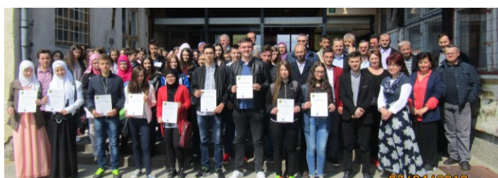
Učesnici 14. općinskog takmičenja iz vjeronauke održanog 07. 04. 2018. u OŠ „Dž. Bijedić“ Miljanovci