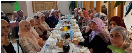
Iftar za žene -06.06.2018.