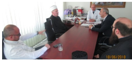
Prijem kod direktora

Općoj bolnici Tešanj, otvorenje sobe za molitvu - 18.06.2018.