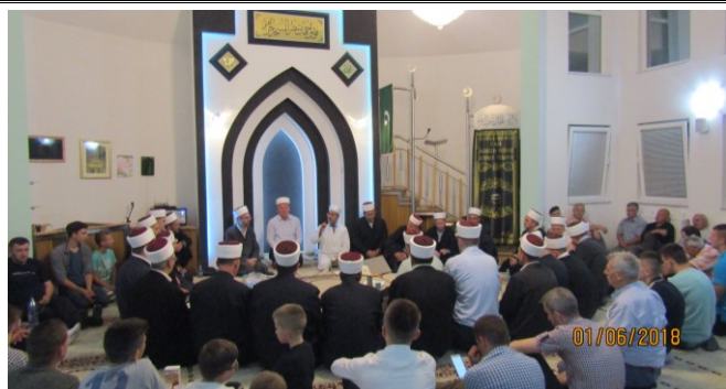
Vukovo–Mevlud–17. noć–Lejletu-l-Bedr, 01.06.2018.