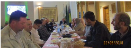
Iftar Aktiva vjeroučitelja-22.05.2018.