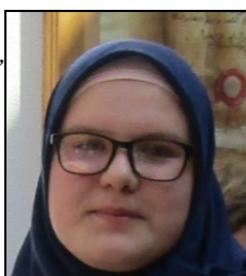
Pobjednici takmičenja na nivou Medžlisa i Muftijstva i 3.na nivou Rijasetu