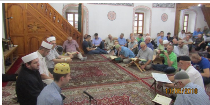
Hafiska mukabela u Čarši-džamiji

Ramazanski bajram 2018. – 1439. (str. 5.)