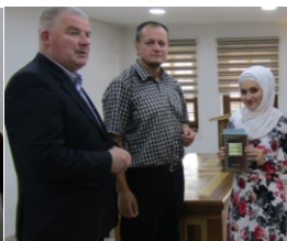
Medžlis – Uručenje nagrada