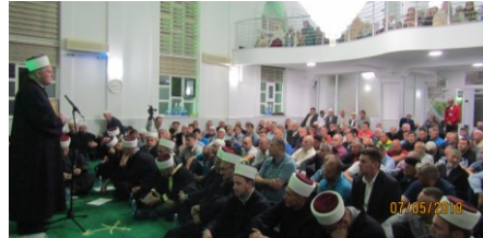
Novi Miljanovci – 12. Večer Kur'ana