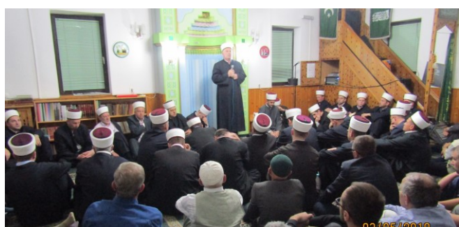
Medakovo – Tradicionalni 23 .Mevlud za šehide

Javni programi – Obilježen 3. maj „Dan šehida“ općine i 7. maj „Dan džamija“ 2018. (str. 6.)