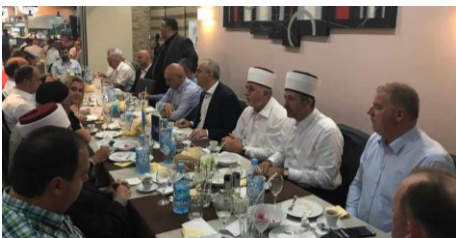
Iftar Udruženja privrednika-08.06.2018.