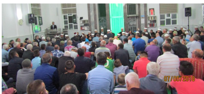
Novi Miljanovci – Tradicionalna 13. „Večer Kur'ana“

Odgaj i obrazovanje – završena mektepska i školska 2017/18. godina (str. 7.)