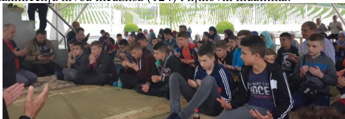
Dova u Potočarima

Ekskurzija u Srebrenicu – Medžlis IZ-e Tešanj i Jedinствена organizacija boraca Tešanj su u nedjelju, 22.04.2018. godine organizirali posjetu Srebrenici i Potočarima svih polaznika mektepske nastave koji su učestvovali na mektepskom takmičenju nivoa medžlisa (124) i njihovih muallima.