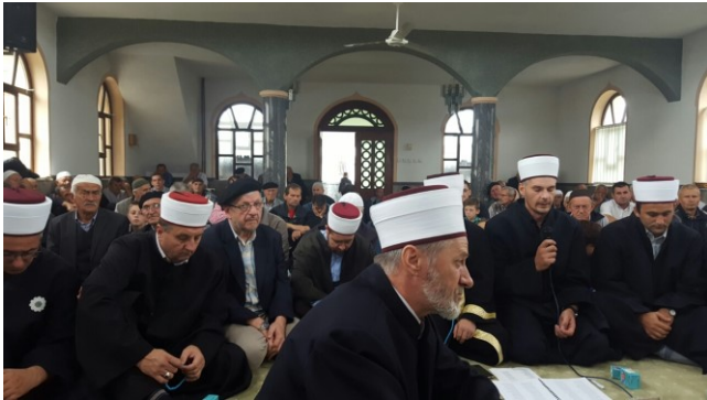
Centralna manifestacija – 02. 10. 2016. Tradicionalni mevlud u Miljanovcima