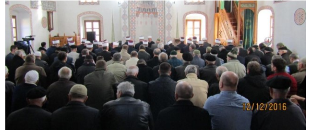
Prisutni na mevludu