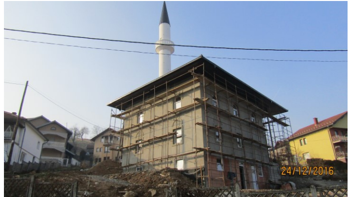
Izgradnja nove džamije u džematu Bukva – 24. 12. 2016.