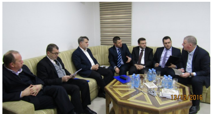
Okrugli sto – 13.12.2016. - Učesnici „Uloga vakufa i privatnog sektora u jačanju i razvijanju lokalne zajednice“.