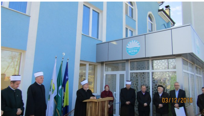
Završeni radovi na adaptaciji prostora u suterenu Kutahya džamije i svečano otvoreno obdanište „REVDA“- 03.12.2016.