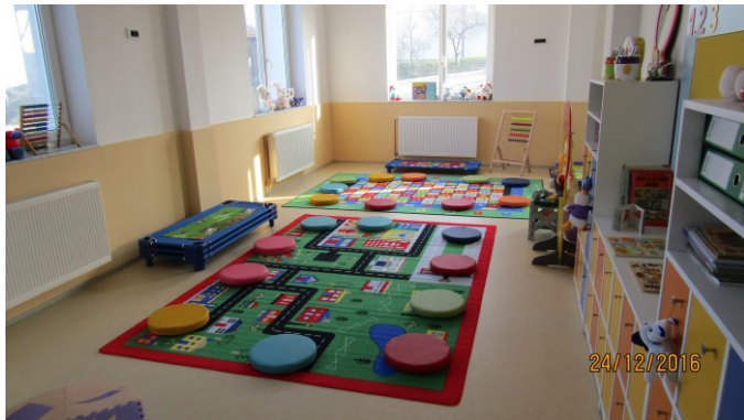
Opremljeni prostor dječijeg obdaništa

Dječije obdanište „Revda“ u suterenu Kutahya džamije – 24. 12. 2016. Od postavljanja kamena temeljca 08. jula 2016. zvršena adaptacija, postavljene instalacije, uređen prostor i postavljen namještaj, sve spremno za početak rada obdaništa.