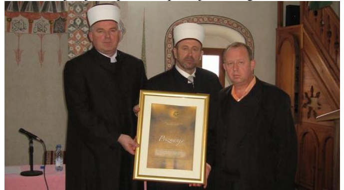
Glavni imam uručio Pohvalu IO Medžlisa IZ-e Tešanj