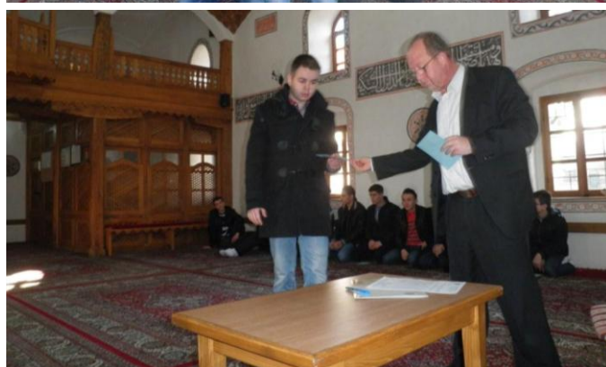
Sa maturantima medresa kojima su uručene stipendije

Tešanj; OŠ „Huso Hodžić“ 25.01.2014.g. – održan tradicionalni malonogometni turnir učenika ove škole u organizaciji aktiva nastavnika Islamske vjeronauke u sportskoj dvorani ove škole.