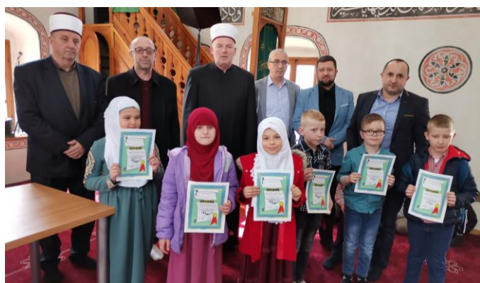
Pobjednici I nivo

Napomena: Svaki takmičar je mogao ukupno osvojiti 60 bodova na takmičenju što je ukupno 360 bodova po džematu. Od mogućih 11.160 ukupno je osvojeno 7.091,64 bodova (181,25 više nego prošle godine ) što predstavlja 63,54 % (što je 1,62% više nego prošle godine).