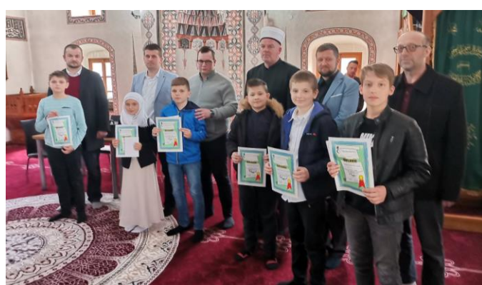
Pobjednici II nivo

Na takmičenju nivoa muftiluka zeničkog 15.05.2022. u Tešnju, ovaj Medžlis će predstavljati: