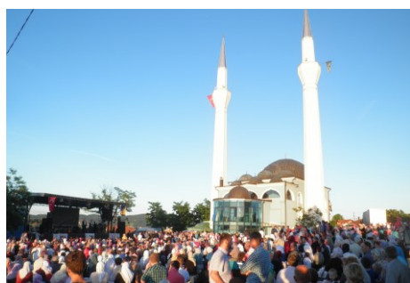
Iftar sa općinom Tešanj i Bajrampaša