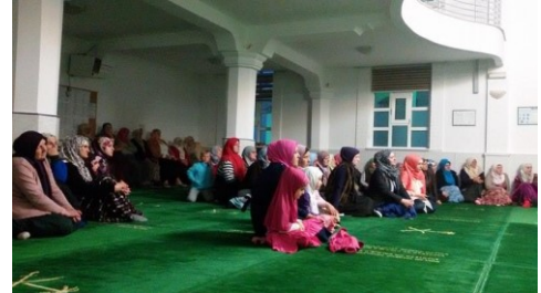
Dio prisutnih žena na tribini

30.04.2016. – Mrkotić-Putešić – proučen tradicionalni 14. mevlud za šehide