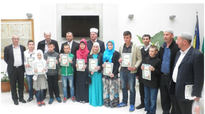
Pobjednici takmičenja iz mektonske nastave održanog 10. 04. 2016. u Tešnju

Odgovj i obrazovanje – završena mektonska i školska godina (str. 5.)