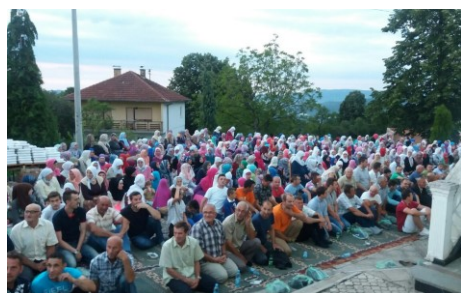
Tradicionalni iftar u Šijama