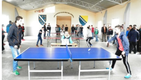
Omladinski turnir u stolnom tenisu