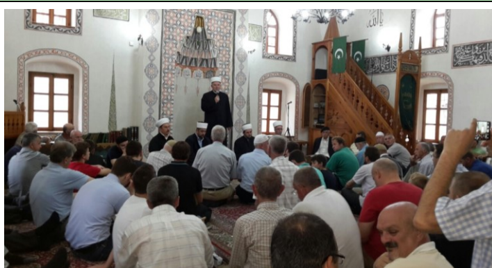
Hafiska mukabela u Čarši-džamiji

Javni programi – Obilježen 3. maj „Dan šehida“ općine i 7. maj „Dan džamija“, (str. 6.)