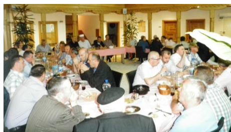
Iftar za zaposlenike i članove IO

Brojni iftari su organizirani u džematima (Šije, Piljužići, Miljanovci, Jevadžije, Oraš Planje, Mrkotić-Putešić...) -