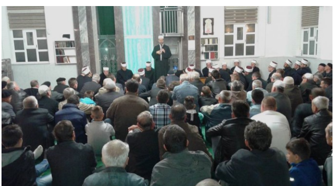
Miljanovci Novi – 03. 05. 2016.- Mevlud za šehide

Javni programi – Obilježen 3. maj „Dan šehida“ općine i 7. maj „Dan džamija“, (str. 6.)