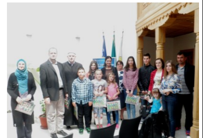
Pobjednici na konkursu

07.05.2015. Miljanovci Novi – održana deseta tradicionalna „Večer Kur'ana“ kao Centralna manifestacija Medžlisa i Muftiluka zeničkog u džamiji ovog džemata poslije akšam-namaza, poslije akšam-namaza.