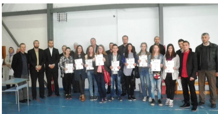
Pobjednici 12. općinskog takmičenja iz vjeronauke održanog 09. 04. 2016. u OŠ „Rešad Kadić“ Tešanj