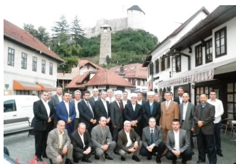
Iftar za profesore