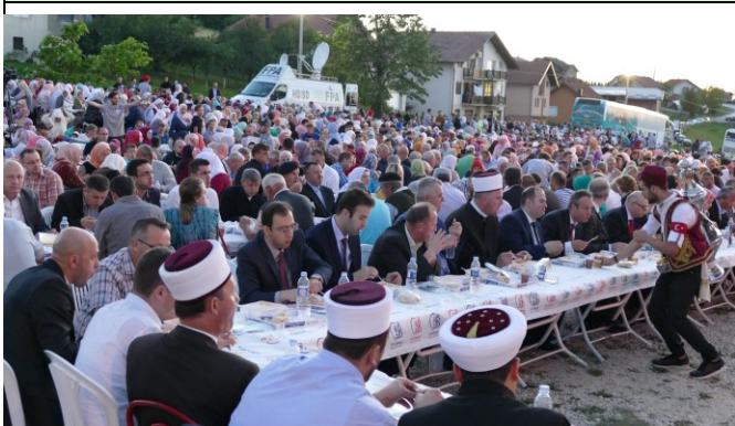
Iftar za 2000 postača sa Općinom Bajrampaša