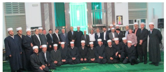
Zajednička fotografija poslije programa