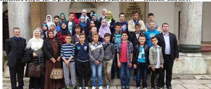
Ispred „Begove“ džamije u Sarajevu

Nagradno putovanje u Sarajevo na finano takmičenje - ove godine Medžlis IZ-e Tešanj je organizirao nagradno putovanje u Sarajevo, obilazak grada i prisustvo završetku finalnog takmičenja polaznika mektepske nastave na nivou Rijasetu za sve takmičara iz džemata koji su učestvovali na takmičenju nivoa Medžlisa iz kategorije Kiraet stariji uzrast i za prvih pet plasiranih na istom takmičenju iz Općeg znanja i Kiraeta – mlađi uzrast.